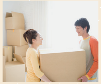
お子さまの独立・結婚