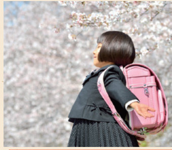
お子さまがもうすぐ小学生になる