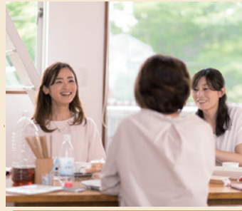
あなたの家を「いいね」と言ってくれた